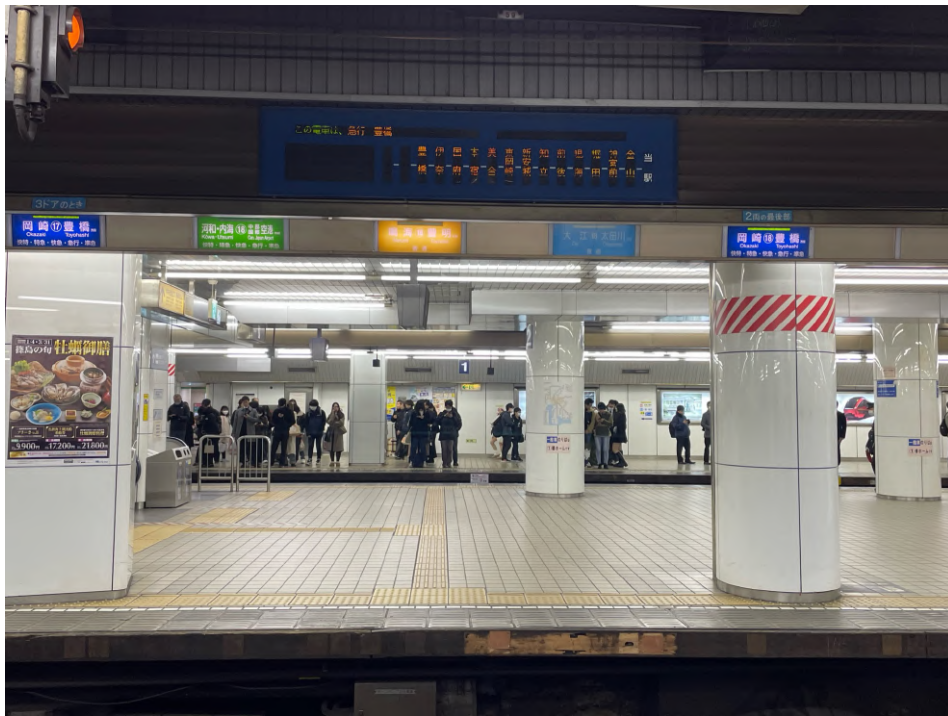
名鉄名古屋駅の4番ホーム（知立・豊橋行き）の様子。「岡崎・豊橋方面」と記載のある濃い青のランプが付いていて、電光掲示板では「新安城」の文字がある。これに乗れば乗換駅である新安城に行ける。