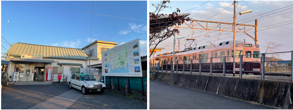
左) 吉良吉田駅の様子。右) 吉良吉田～蒲郡間を走るワンマン電車。