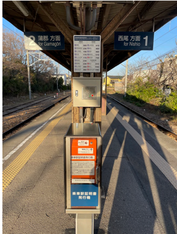
西浦駅の乗車駅証明書発行機。