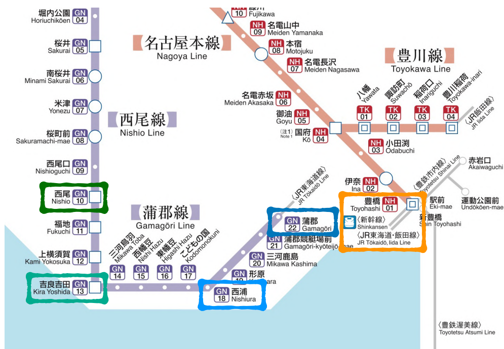
会場最寄駅（GN18西浦駅）周辺の名鉄路線図。主要駅を枠で囲った。図には載っていないが、NH01豊橋駅とGN22蒲郡駅はJR東海道本線で繋がっている。