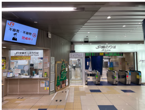
蒲郡駅の様子。上2枚は南口側、左下は名鉄の改札、右下はJRの改札。